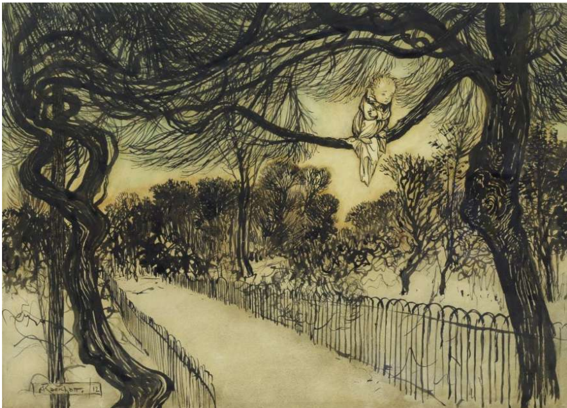
Peter Pan in Kensington Gardens / Arthur Rackham

Par ailleurs, il est actuellement batteur dans les groupes Fear of the clippers (Rock Prog), Seven Ages (Stoner / Pop) et Blod dyr (World).