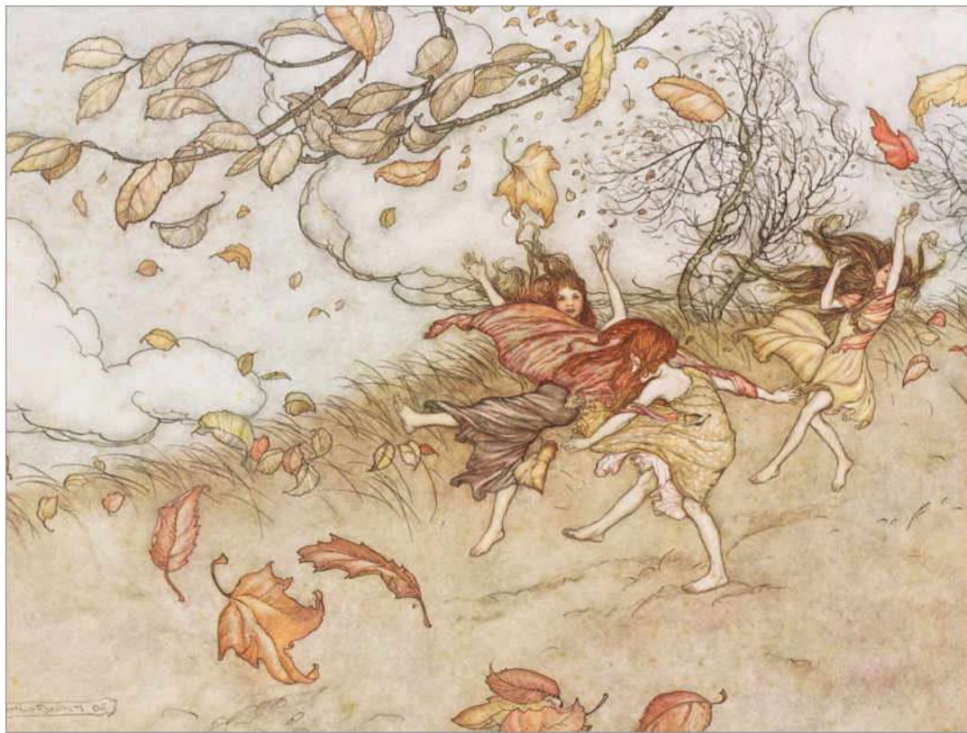
Peter Pan in Kensington Gardens / Arthur Rackham