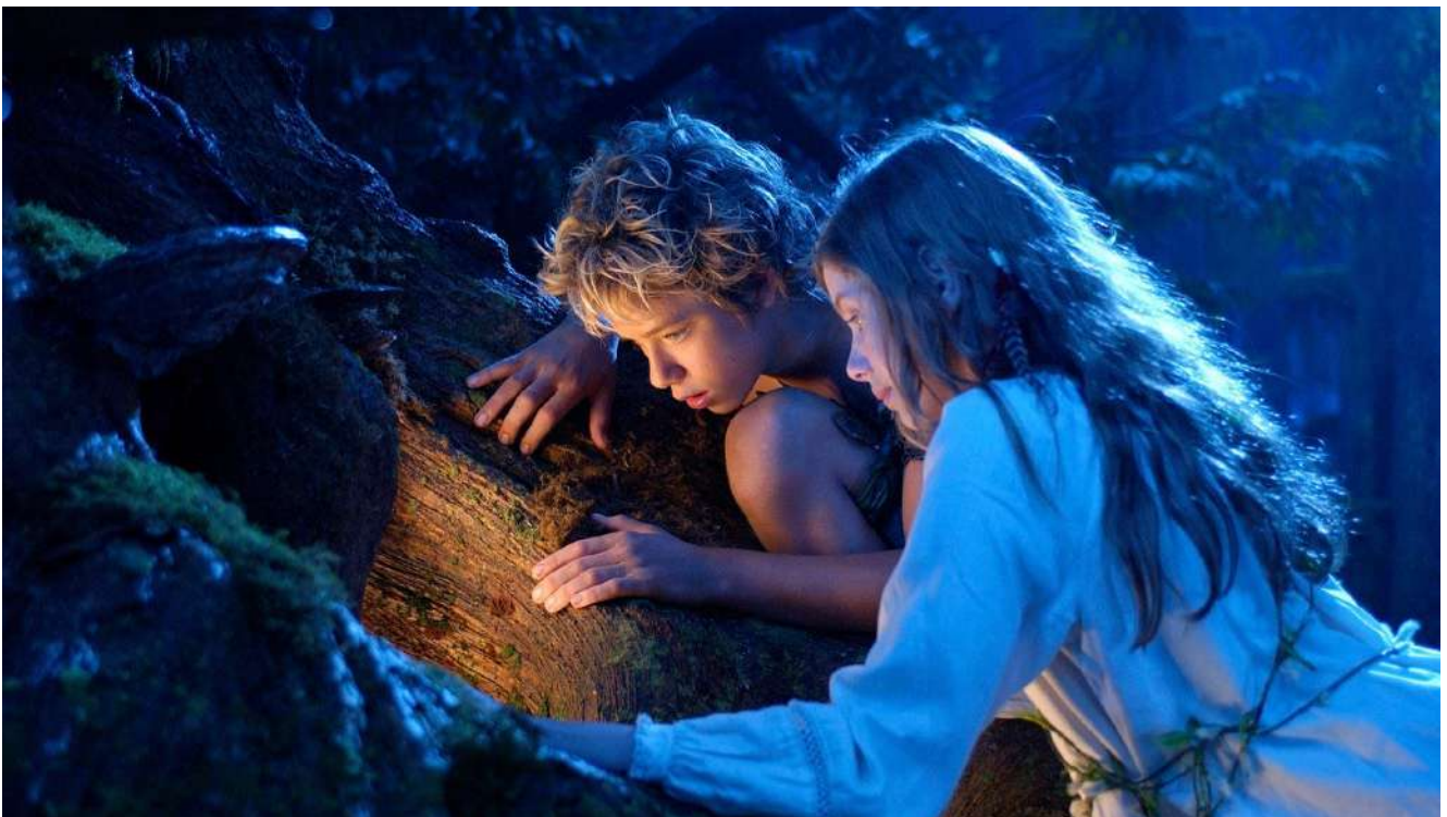
Peter Pan / P.J. Hogan

Réfléchir aux différences entre les diverses versions, en les comparant au texte original.